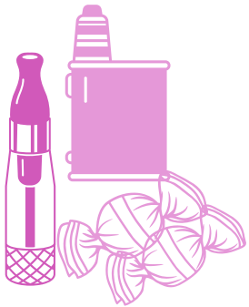
Productos recreativos para adultos

No deje productos recreativos de adultos, como nicotina líquida/vaporizadores y comestibles de marihuana.